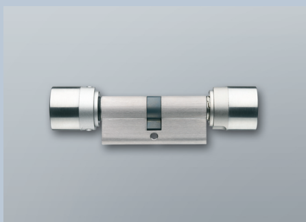
Digitaler Schließzylinder mit Tastersteuerung

Schließzylinder mit gekapselter Elektronikbaugruppe zum Einbau in Türen nach DIN 18250 mit Europrofilenschlössern nach DIN 18251. Er wertet die Funksignale von Transpondern aus und entscheidet, ob eine Zugangsberechtigung besteht.