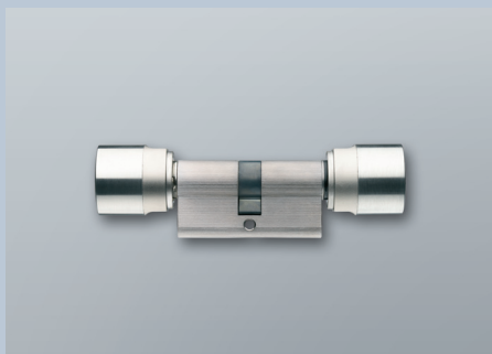
Digitaler Schließzylinder 3061