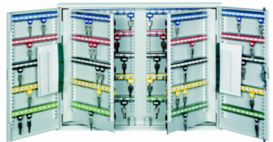
Schlüssel-Schrank SPD 400

Aus Stahlblech gebogen, elektrisch geschweißt. Tür mit allseitigem Rand im Falz einschlagend, Zylinderschloss, 2 Schlüssel. Hakenleiste stufenweise verstellbar, verschiedenfarbig, fortlaufend nummeriert. Übersichtliche Nummerntabelle. Hakenzahl ist identisch mit Modellkurzbezeichnung. Mit Baskühle-Verschluss, nach drei Seiten schließend. Ab 400 Schlüsselhaken mit zwei, bei 600 Schlüsselhaken mit vier voll ausschwenkbaren Zwischenwänden ausgestattet. Lackierung: RAL 7035 lichtgrau.